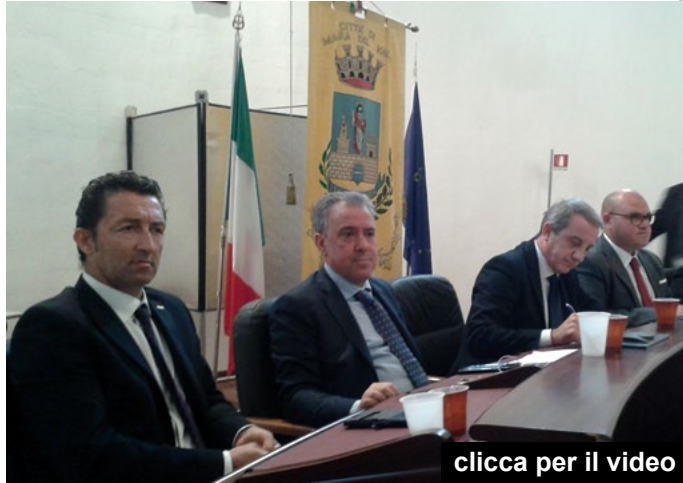
clicca per il video

motivo per cui, essendo i lavori di ristrutturazione del nosocomio mazarese ormai in dirittura d'arrivo ed avendo già predisposto un bunker per la radioterapia non si decida di fare un reparto complesso a Mazara del Vallo e invece si vuole attendere che tale reparto nasca a Trapani, dove per altro ancora deve essere confermato il finanziamento per la radioterapia, devono successivamente essere fatti gara e lavori e pertanto l'entrata in funzione di tale struttura al nosocomio di Trapani non potrebbe avvenire