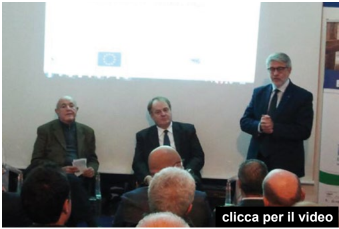
clicca per il video